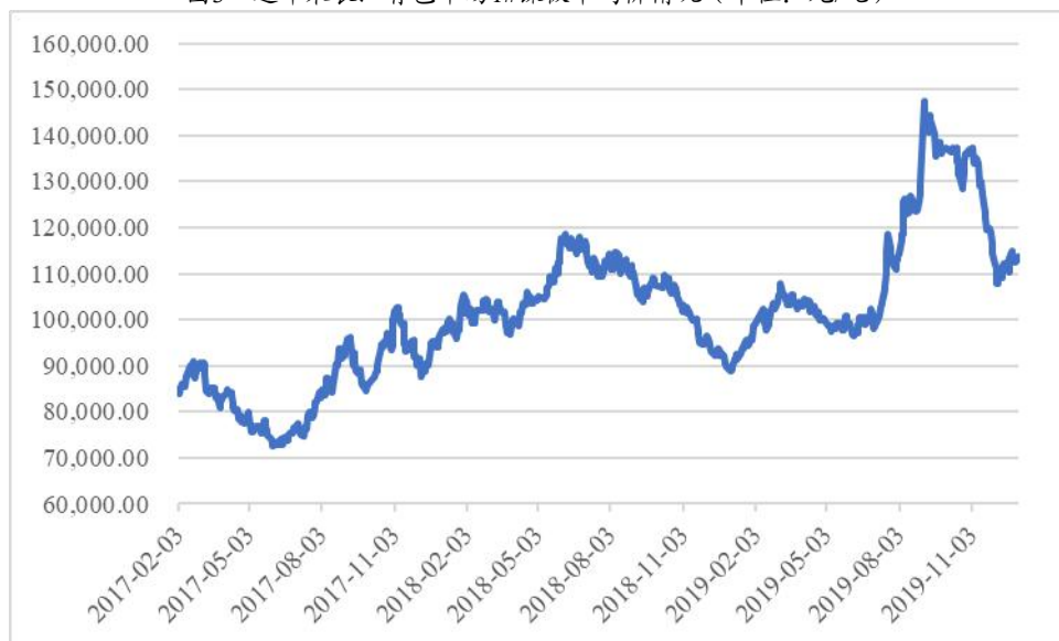
图3 近年来长江有色市场1#镍板平均价情况(单位:元/吨)

公司主要原材料为不锈钢圆钢、不锈钢卷板和不锈钢平板,其中,镍价走势为不锈钢和特种合金价格走势的风向标,上游原材料价格受镍价走势影响较大。受环保政策压力影响,2019年,我国电解镍产量为195,956.00吨,同比下降3.12%。我国是镍的消费大国,但在全球镍矿垄断的背景下,不具有定价权,导致国内镍价走势受制于国际市场。受大宗商品市场波动影响,2019年镍价震荡幅度较大,上半年小幅下滑,下半年大幅上升然后回调。镍、铬铁等原材料价格的大幅波动对工业用不锈钢生产成本影响较大,从而造成产品毛利率指标一定程度的波动。此外,原材料价格的持续波动会对企业的经营管理带来一定影响,原材料价格持续上涨将占用企业更多的流动资金,从而加大资金周转的压力。